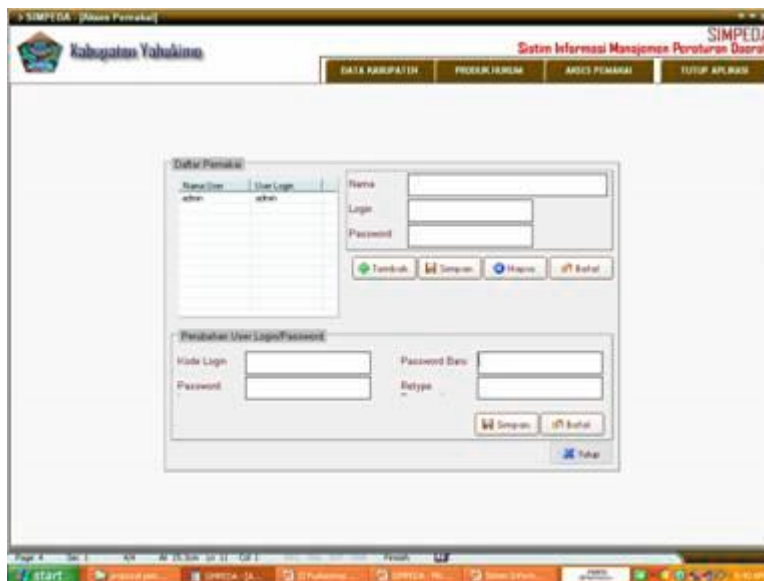
Gambar tampilan Akses Pemakai