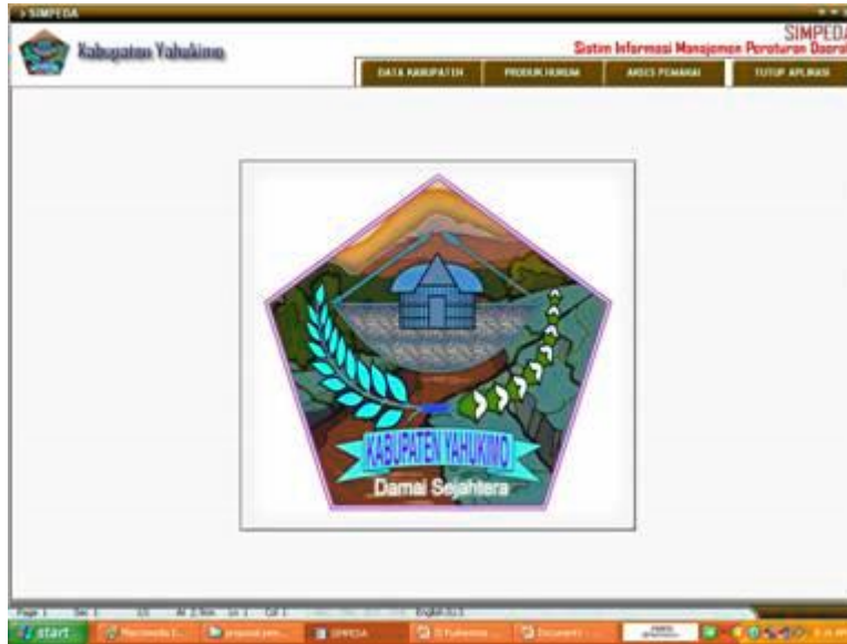
Gambar tampilan depan SIMPEDA