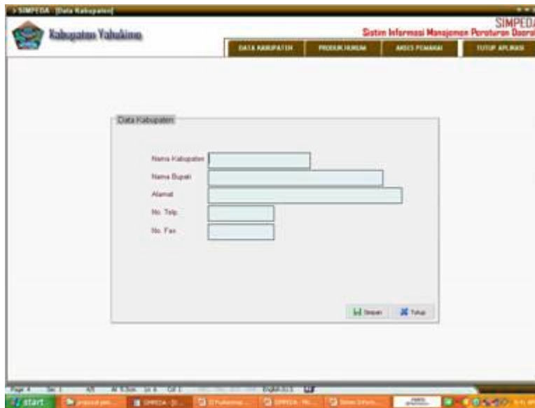
Gambar tampilan Data Kabupaten