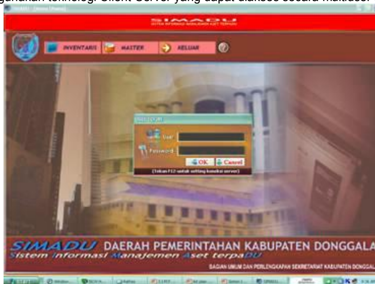
Gambar Tampilan Depan SIMADU

Dengan menggunakan SQL Server 2005 untuk menjamin keamanan, kehandalan dan kecepatan data. Kelebihan lain SIMADU menggunakan teknologi Client-Server yang dapat diakses secara multiuser melalui jaringan LAN.